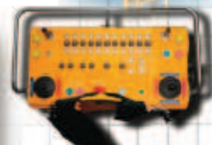
EURO mit 2 zweiachsigen Meisterschaltern