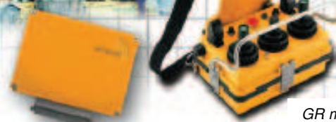
GR mit 3 zweiachsigen Meisterschaltern